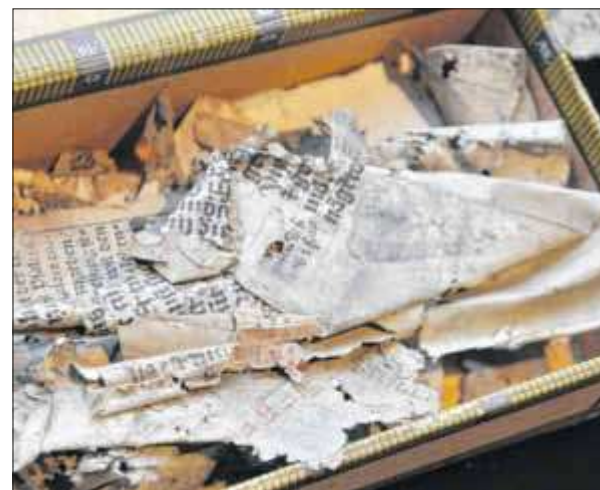
Dieses kleine Kästlein enthält Fragmente von uralten Buchseiten.