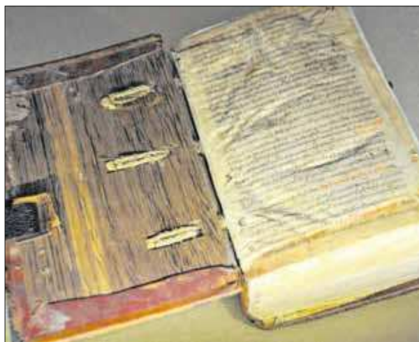
Handschrift auf Pergament – einer der wertvollen Kirchenbibliotheksschätze.